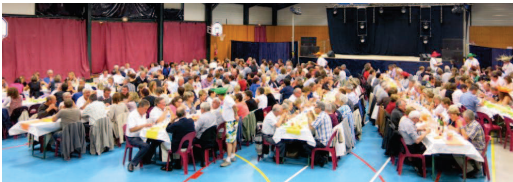
Grande soirée festive le samedi avec 300 convives venus assister au remarquable spectacle "Passport pour le soleil" de la revue CARNAVALERA

Un grand bravo aux associations qui ont contribué à la réussite de la fête patronale et plus particulièrement aux Vétérans du Foot qui ont assuré l'organisation de la soirée.