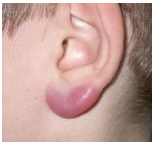
lymphocytome cutané bénin

Attention, avoir déjà contracté la maladie de Lyme n'immunise pas contre une nouvelle infection.