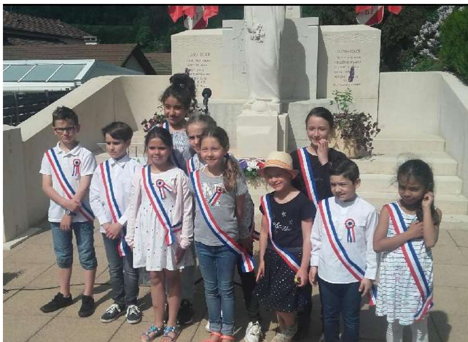
Conseil municipal des enfants le 8 mai 2018

Cette première année a été enrichissante pour tous nos jeunes élus. Nous espérons qu'ils continueront à s'impliquer dans la vie communale et à développer de nouveaux projets.