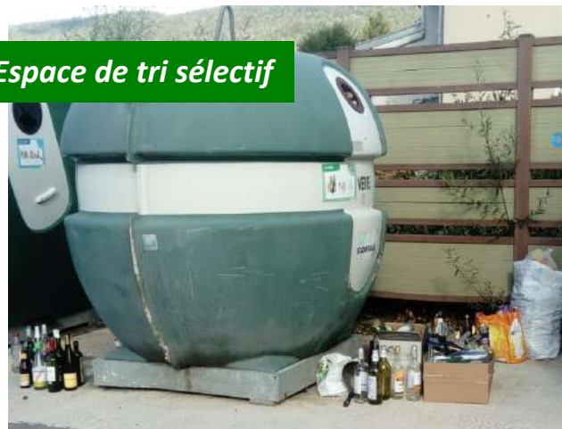
Cinq espaces de tri sur la commune, alors si un conteneur est plein rien ne sert de déverser le sac au pied de celui-ci, les quatre autres sont prêts à vous accueillir.