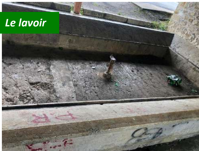
Le lavoir, témoin de notre histoire locale, mérite plus de respect et de considérations : tags, bouteilles cassées, déchets ....