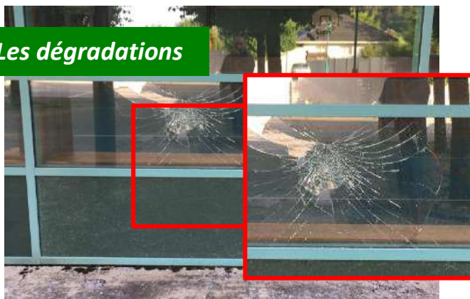
Nous disposons de superbes équipements : écoles, complexe du Lange, jeux des enfants. Un peu stupide de les dégrader. N'oublions pas que c'est la collectivité qui paye les assurances, les franchises et au final les réparations par l'intermédiaire des impôts.

Depuis de nombreuses années, les différents mandats ont fait évoluer le village, l'ont modernisé. La rénovation des rues, le panneau lumineux, le centre village et autres réalisations, nous permettent de vivre dans un environnement très agréable.