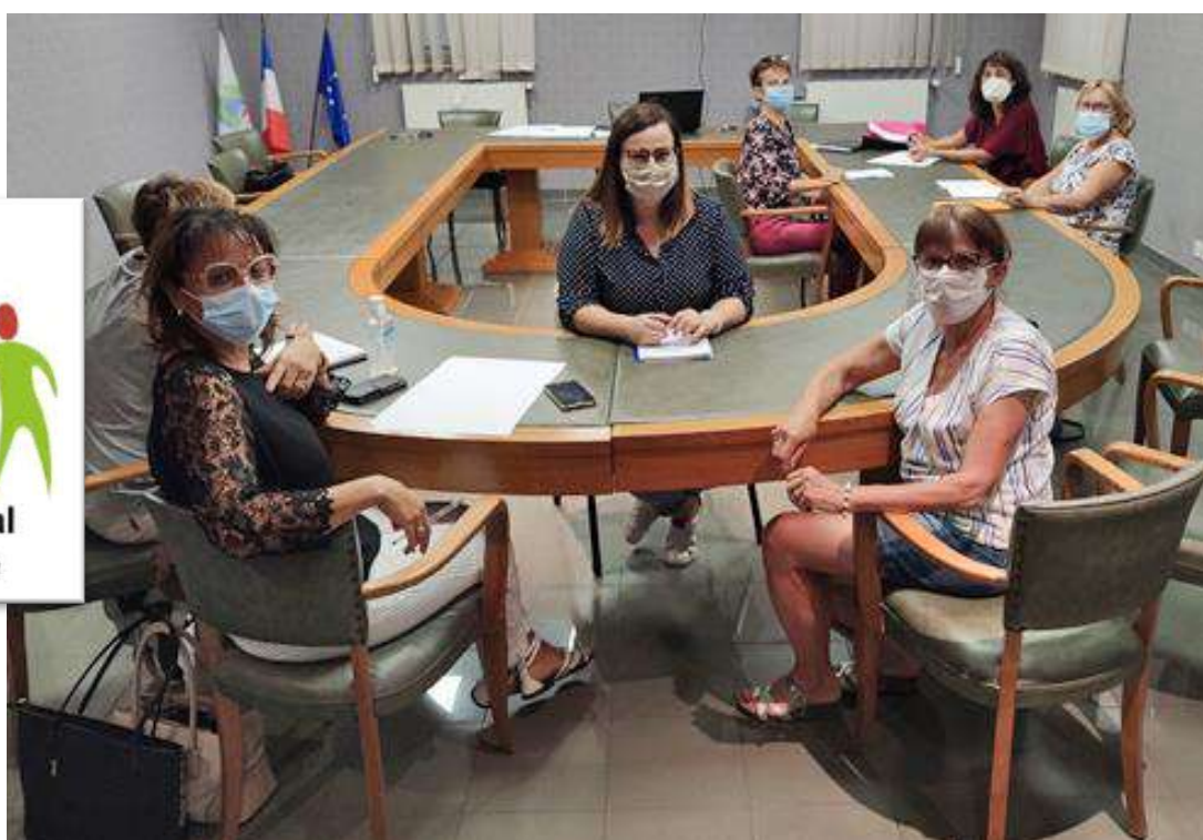
Première réunion du nouveau C C A S, absents : P.VAHIER et J.ISSARTEL (le photographe)