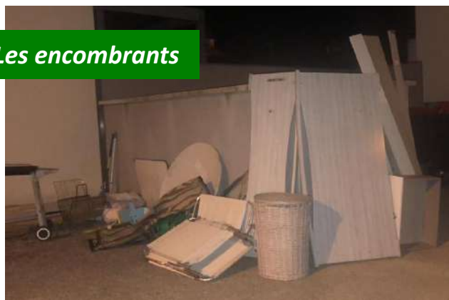
Un service qui donne la possibilité à chaque habitant de déposer ses encombrants le 1 er mercredi du mois devant chez lui : pas d'entreposer ses ordures dans la rue au gré de ses besoins