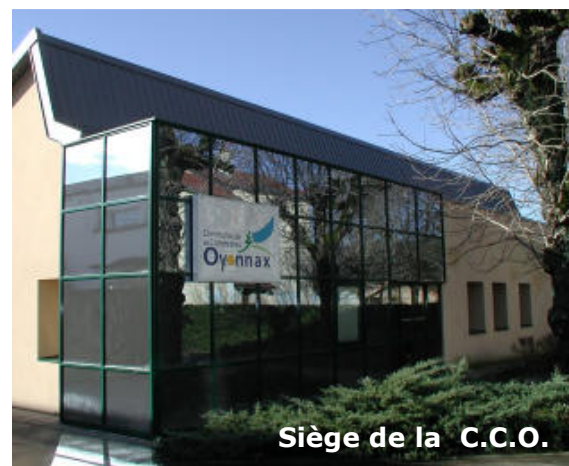
Siège de la C.C.O.