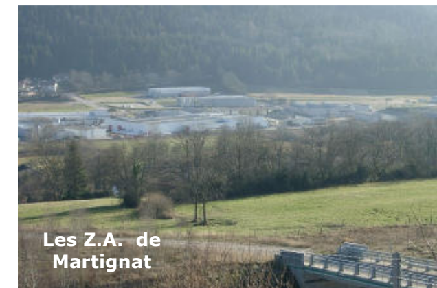
Les Z.A. de Martignat