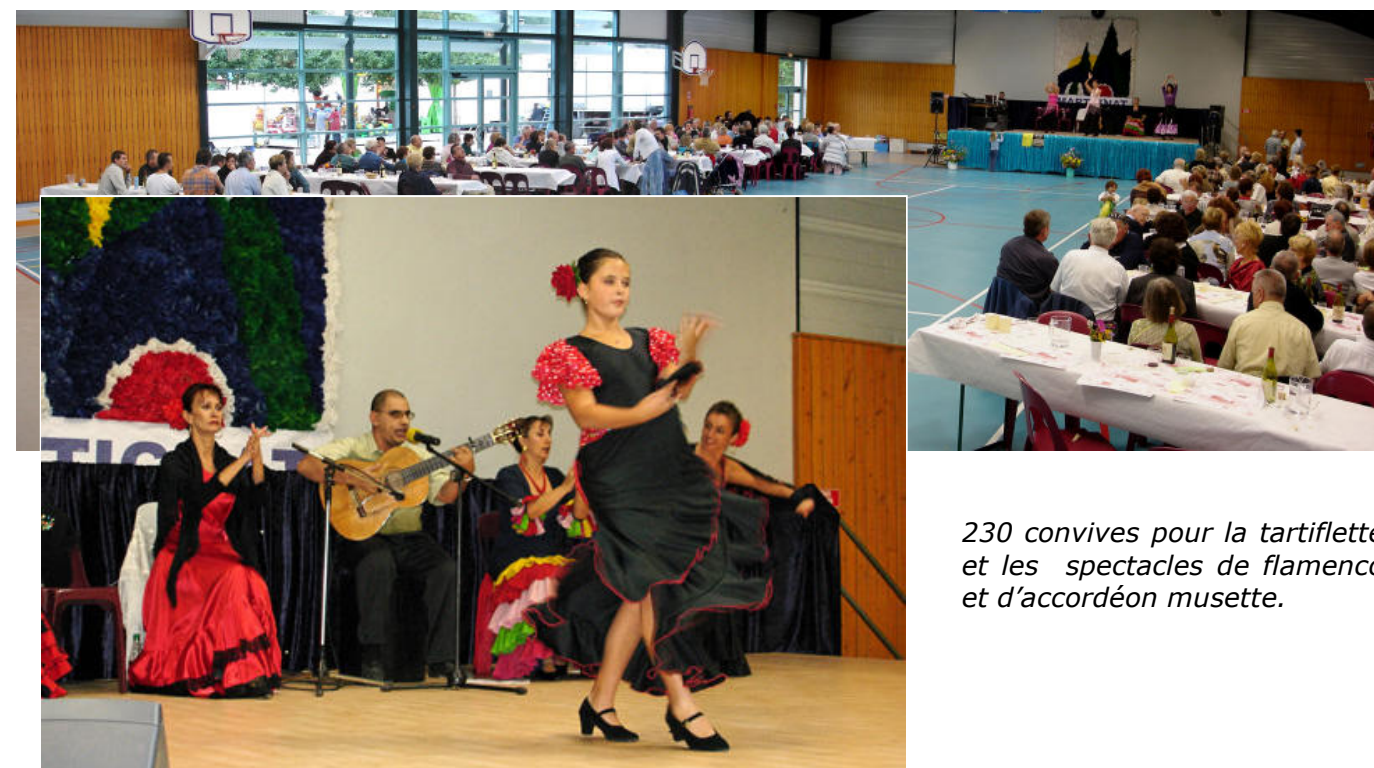
230 convives pour la tartiflette et les spectacles de flamenco et d'accordéon musette.

Merci au comité d'organisation et à tous les bénévoles, et si, à l'avenir vous souhaitez vous investir dans la vie de notre cité, vous serez les bienvenus au sein de la commission socioculturelle.