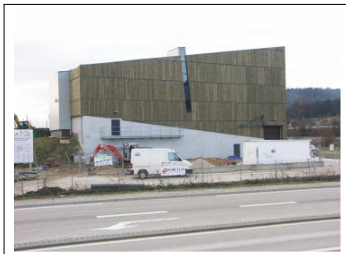
Etat actuel du chantier

Le coût total des travaux de démolition-reconstruction s'élève à 467 725 euros H.T.