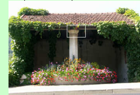
Il s'agissait du lavoir de la Grand Rue