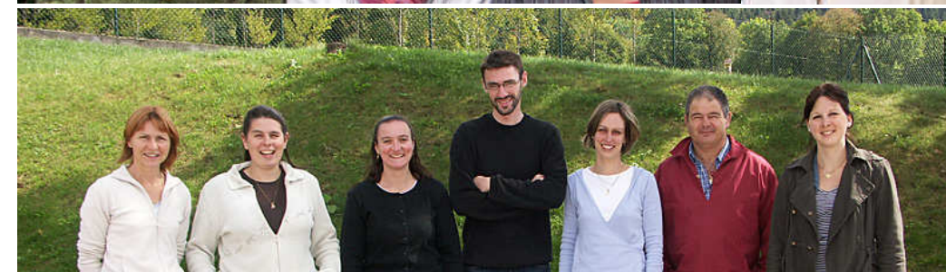
Les équipes enseignantes des écoles maternelle (haut) et primaire (bas).