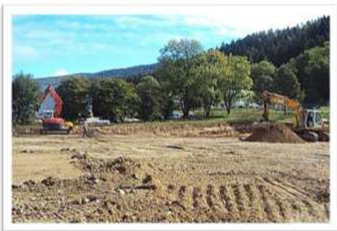
L'entreprise DEVIRIS s'installe à côté de MARTIPLAST Recyclage et régénération des plastiques