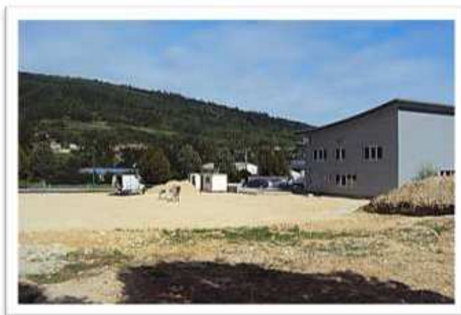
La société D.M.A. agrandit son bâtiment. Fabrication de machines spéciales