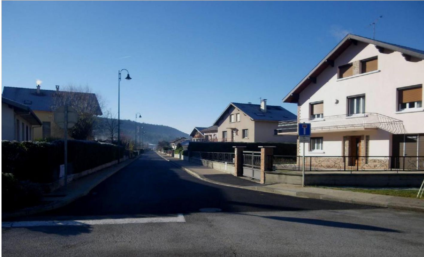
La rue de la Bierle rénovée

Il a été procédé à la mise en séparatif des réseaux d'assainissement (eaux usées et pluviales) ce qui fait que tout le village est en conformité. Cette rue était la dernière à ne pas en être équipée. Concernant les réseaux secs, l'électricité et le téléphone ont été enfouis ainsi qu'une gaine prévoyant l'installation prochaine de la fibre optique. Un nouvel éclairage et des poteaux incendie ont été mis en place. Et pour terminer, le nouveau revêtement de sol en enrobé apporte un meilleur confort de circulation aux usagés. Progressivement, les rues de Martignat s'embellissent et améliorent notre cadre de vie.