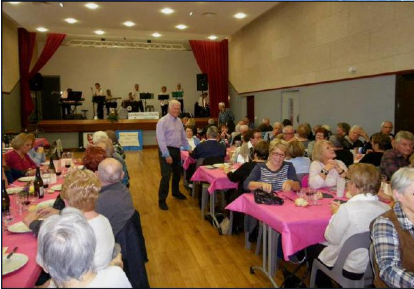
Repas des Aînés le 21/11/15 animé par les Marins de l'Oignin