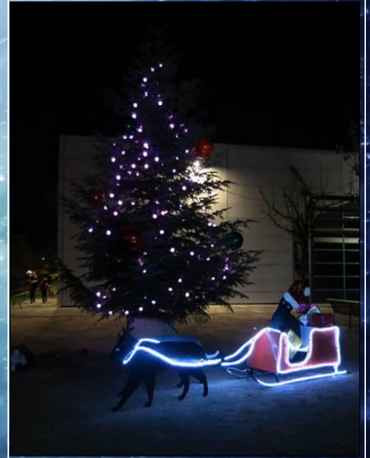
Illuminations le 11/12/15