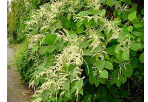
Photos de renouée asiatique

Cette année un nouveau plan d'aménagement forestier 2016/2025 va être mis en place par l'ONF.