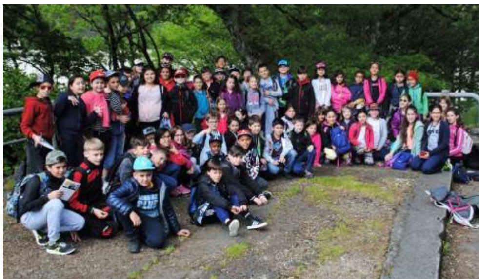
Classe découverte en Auvergne des CE2-CM1-CM2 lors de la visite du barrage de Bort-les-Orgues

Partir ainsi donne l'occasion aux enfants de découvrir et d'apprendre autrement. C'est toujours une grande expérience de partager avec les copains des moments inoubliables loin de la maison et des parents !!!