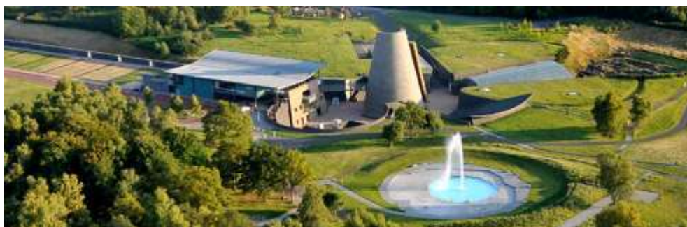
Le site de Vulcania