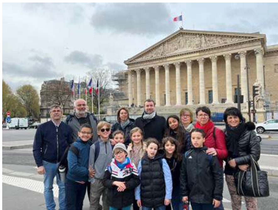
Conseil Municipal des Enfants et élus devant l'Assemblée Nationale

Le projet qui nous tenait à cœur cette année a été réalisé en deux temps. Tout d'abord, nous avons organisé une journée "viens à pied t'as gagné !" le 5 mai dernier afin de sensibiliser nos camarades sur la pollution des voitures. Puis cette journée a été reconduite sur une semaine complète. A l'issue de cette semaine, la mairie a offert un jeu de société pour chaque classe afin de récompenser l'effort collectif. Une majorité de nos camarades a participé à l'opération.