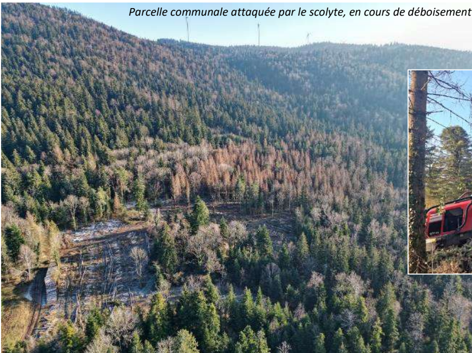
Parcelle communale attaquée par le scolyte, en cours de déboisement