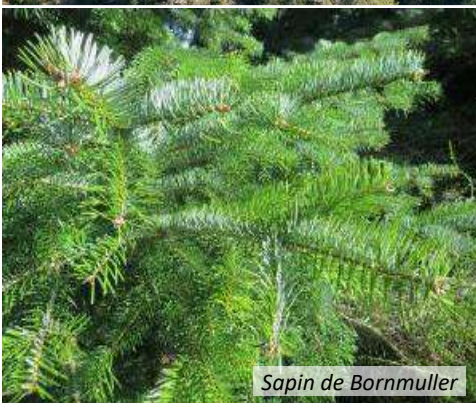
Sapin de Bornmuller