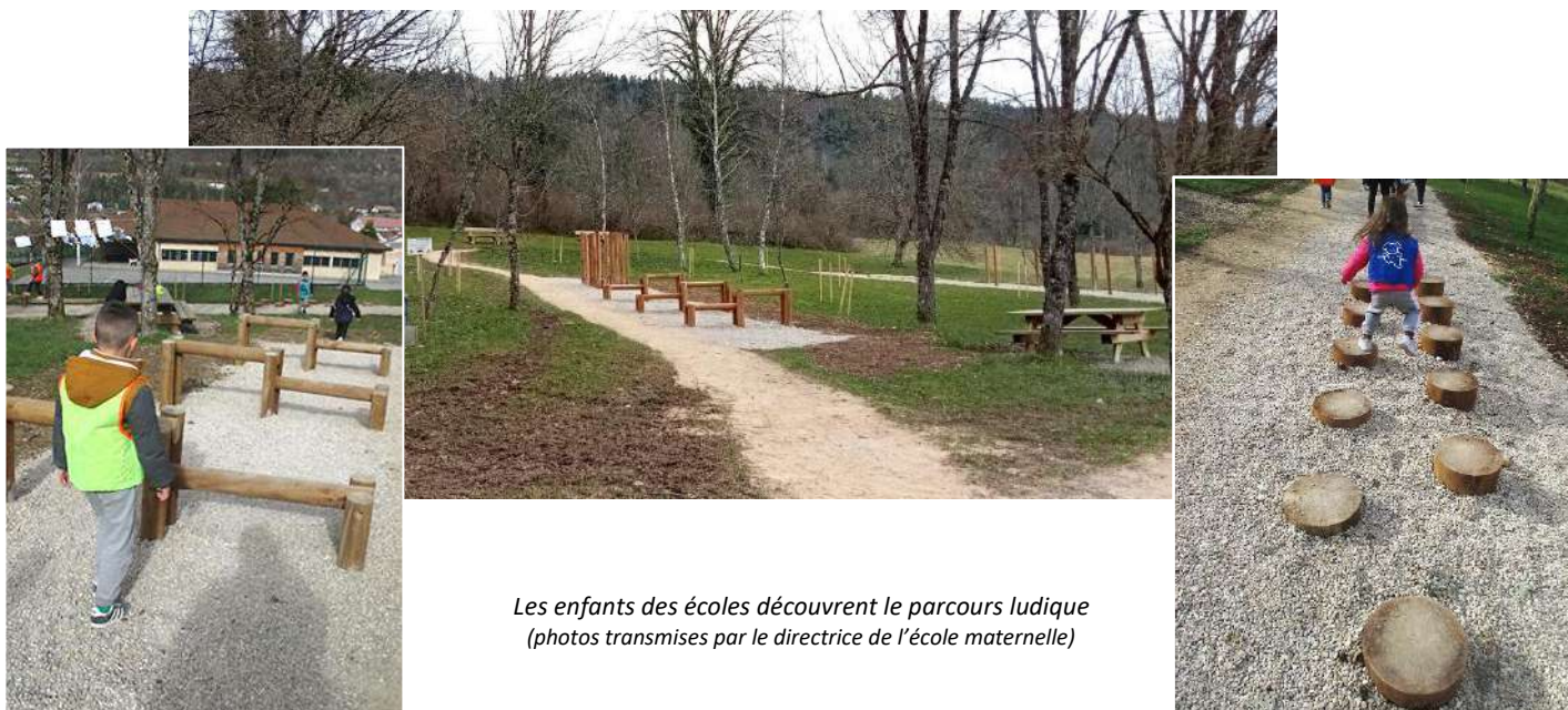
Les enfants des écoles découvrent le parcours ludique (photos transmises par le directrice de l'école maternelle)

Venez le découvrir seul ou en famille, vous reviendrez sûrement !