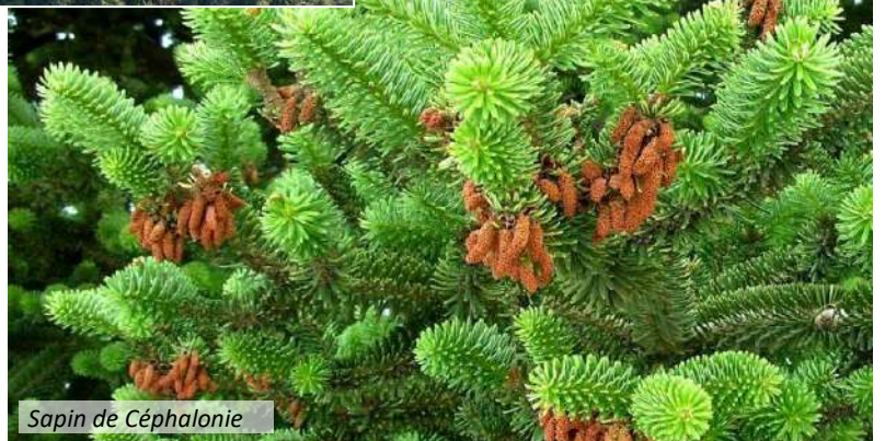
Sapin de Céphalonie

NOTA : À la suite de coupe de parcelles de bois sec, la commune a pu proposer quelques lots de bois de chauffage à ses habitants. La communication en a été faite mi-mars par ILLIWAP et le panneau lumineux pour une inscription jusqu'au 11 avril.